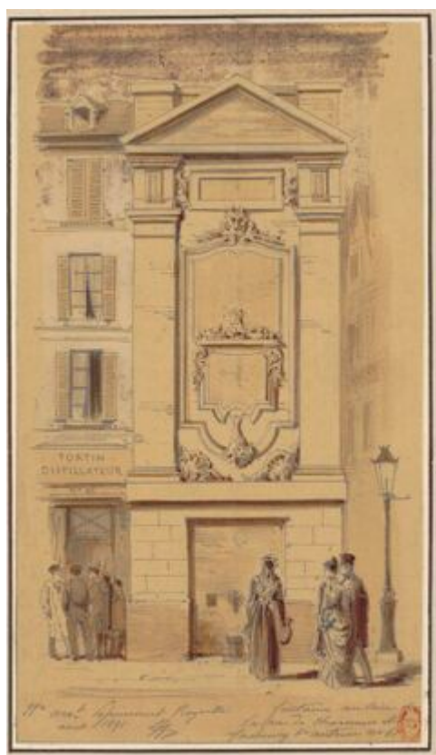
Fontaine au coin de la rue de Charonne et du faubourg St Antoine n° 61, dessin, Jules-Adolphe Chauvet, 1891.

Mon conseil : posez bien le champ de votre recherche. Imaginez vous ouvrir une malle au trésors contenant 8 millions de documents... Il est donc important de noter les informations en votre possession et les recherches que vous utilisez. Le moteur de recherche reste une machine qui ne fera que ce que vous lui demandez.